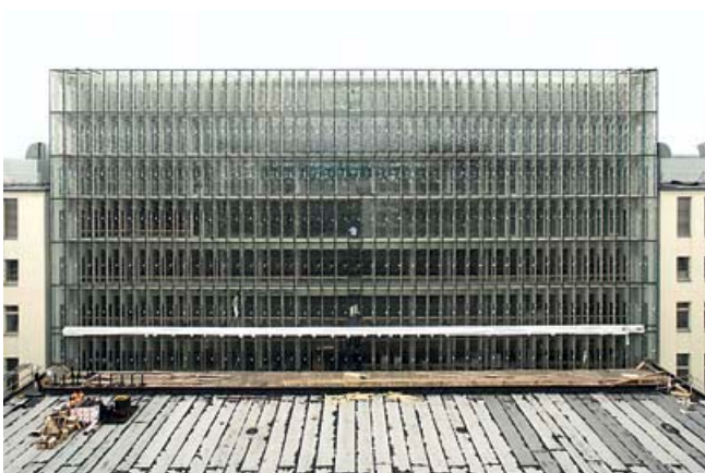
Fasada okienna nowej centralnej czytelnii Biblioteki Narodowej w Berlinie

Podstawą adaptacyjnego systemu sterowania oświetleniem jest macierz z danymi o natężeniu światła stworzona przez Instytut Techniki Oświetlenia Dziennego w Stuttgarcie. Dane do macierzy obliczono, wykorzystując symulację