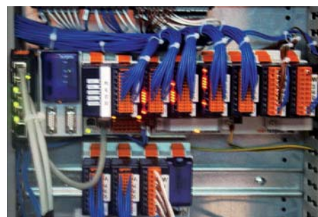
Szafka sterownicza pompowni ze sterownikami Saia®PCD3